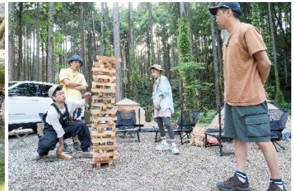
（不思議なパワーを宿した矢作）（リバーサイドでチェアリング）（焚き火用の薪でジェンガ対決）