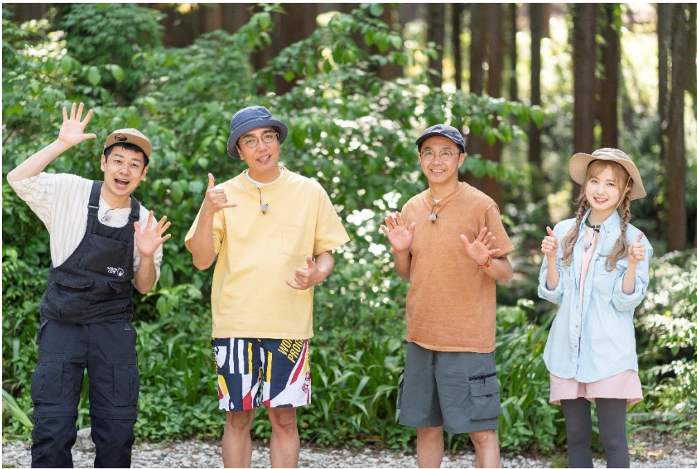
(左から、江凸崎馬門、小木博明、矢作兼、本田仁美)

6月15日(木)放送「おぎやはぎのハピキャン」は、 「馬門流 一周回って王道キャンプ」! キャンプファイヤーを囲んで、食べて踊ってお祭り騒ぎ!