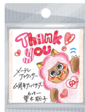
販売されるパックの一例

今回 NFT 化されるイラストは望木アナが「メ〜テレ 60 周年アンバサダー」として番組口けやイベントに参加した際に描きためたもので、地元への思いにあふれた全 9 種類です。また NFT 購入者の皆様には今回描き下ろしたイラストを「おまけ」としてお届けします。