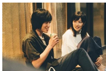
『わたし達はおとな』