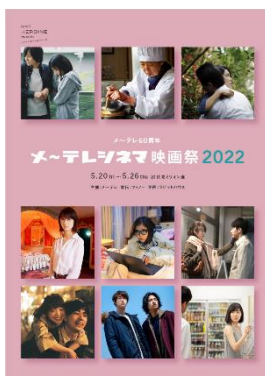
『メ〜テレシネマ映画祭』