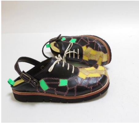
ウドちゃんカラー【サボ】