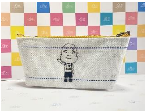
消防ホース製ポーチ