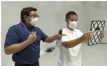
(鏡を使ったトレーニングを伝授)