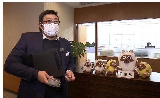
(社内を調査する沖田)

企業レスキューコンサルタントとして、 経営不振の企業を数々 救ってきた 日本のビジネスシーンの「救世主」沖田義盛。 今回、沖田に依頼したのは、低迷が囁かれる テレビ業界の中で戦う「名古屋テレビ放送」。 沖田のコンサルの力によって、 メ〜テレは 厳しいテレビ業界を生き残ることはできるのか!?