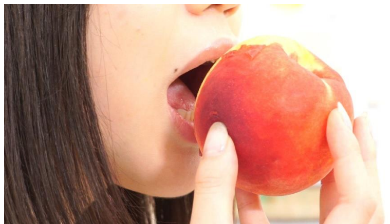
(※桃にかぶりつく早見紗英)

被写体はアイドルグループdelaの 人気メンバー早見紗英。 朝起きたら、ヨガマットで体操をして、 歯を磨いて、髪を整えて、 果汁たっぷりのフルーツを食べる。 可愛らしいしぐさだけでなく、 妖艶な表情にも注目！