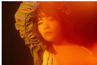
SHE IS SUMMER