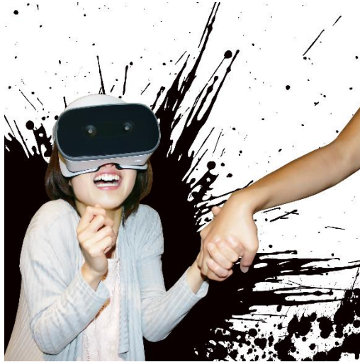
メインビジュアル