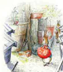
ビアトリクス・ポター 『ベンジャミン・バニーのおはなし』挿絵 水彩・紙

水彩で描かれた直筆原画を中心に、絵本シリーズの世界を展覧します。ピーターのたくさんの仲間たちに出会えます。