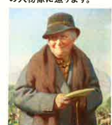
デルマー・バーナー 『ビアトリクス・ポターの晩年の肖像』 油彩・カンヴァス