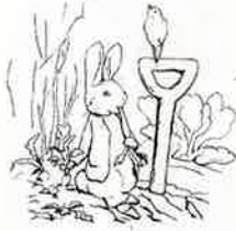
ビアトリクス・ポター 私設版『ピーターラビットのおはなし』挿絵 インク・紙