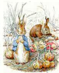
ビアトリクス・ポター 『ベンジャミン・バニーのおはなし』挿絵 水彩・紙