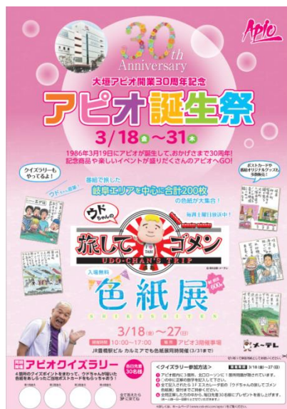
色紙展チラシ (大垣アピオ)