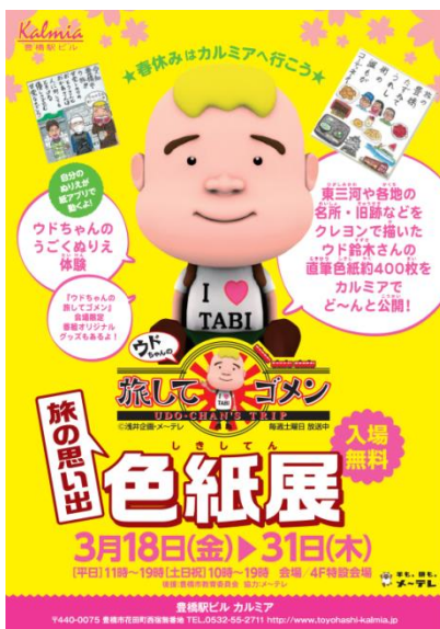
色紙展チラシ (豊橋ステーションビル カルミア)