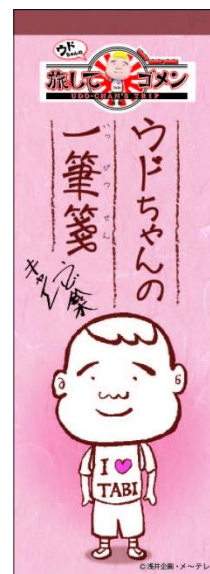
番組オリジナル 「ウドちゃんの一筆箋」