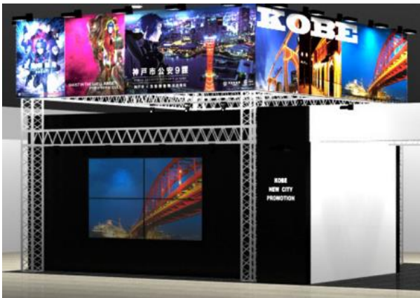
<会場イメージ図> ※変更の可能性あり

今回制作したコンテンツは、SIGGRAPH ASIA 2015（展示会）の神戸市ブースに出展する ヒョウゴベンダが製作した8K モニタ（4K4 面マルチモニタ）で上映する予定です。