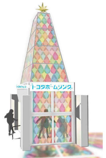
2015年トヨタホームリンク イルミネーション<イメージ>