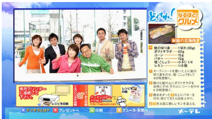
<データ放送画面イメージ>