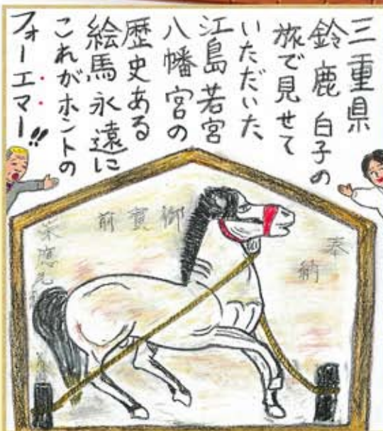
▲三重県 鈴鹿白子の 旅で見せていただいた江島若宮八幡宮の 歴史ある絵馬永遠にこれがホントの フォーエマー!!