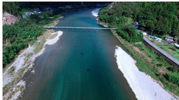
写真2：「四国、秘境をめぐる 仁淀ブルーと秘湯祖谷」より